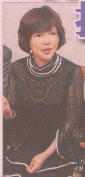
▲紀寶如現在的五官與5歲出道時的模樣差距不大。(資料照片)